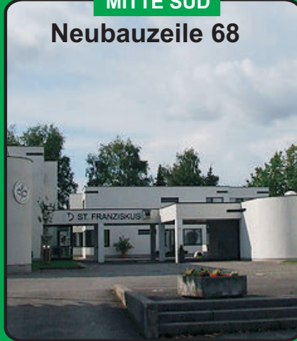
Pfarrk. St. Franziskus