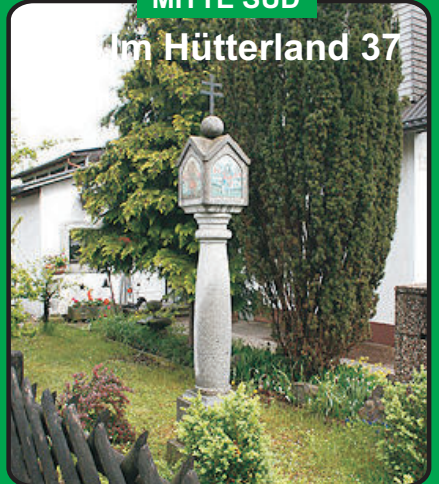
Marterl Im Hütterland