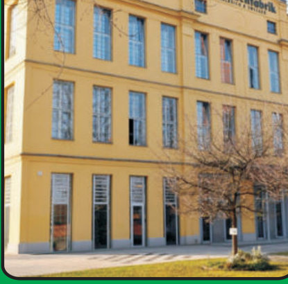
Kirche Marcel Callo